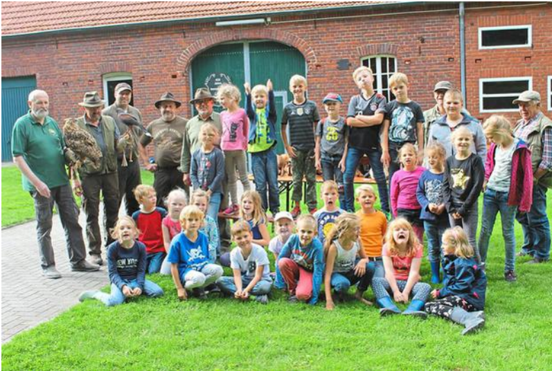
Die Jäger und ihre kleinen Besucher erlebten während der Ferienaktion einen spannenden und informativen Nachmittag.

Horstmar-Leer - Im Rahmen des Ferienprogramms der Stadt Horstmar waren 30 Mädchen und Jungen mit den Jägern unterwegs. Diese hatten einen Parcours mit mehreren Stationen vorbereitet, die die Kinder in kleineren Gruppen durchliefen. Dabei lernten sie anhand von Fellen und Präparaten die heimischen Tierarten kennen.